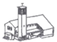
St. Anna, Stromberg