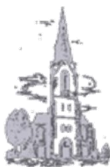
St. Peter und Paul Hbf-Grenshausen