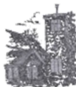
St. Marius, Ransbach