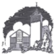
St. Johannes der Täufer Heusort