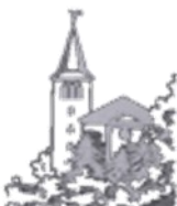
St. Georg, Brettenau