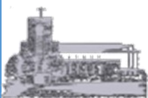
St. Antonius, Beunbach